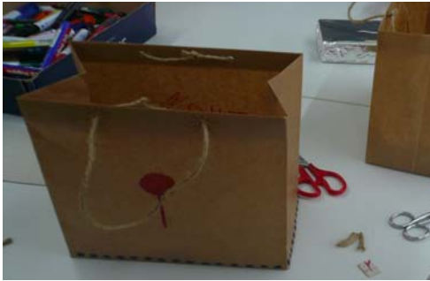
So sah die Tasche von Ella aus

Die Kinder bastelten eine Tragetasche in welche später die Cakepops reinkamen.