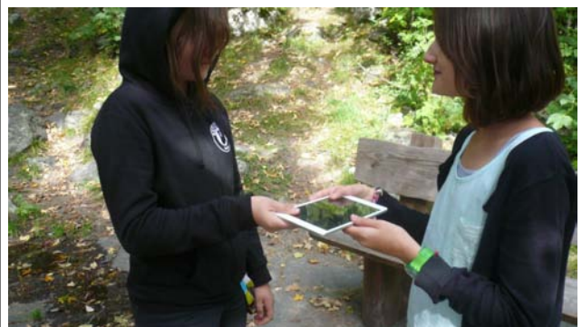
Sie entschuldigt sich und gibt ihr das iPad zurück.